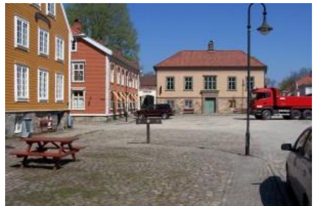
Gamlebyen i Fredrikstad